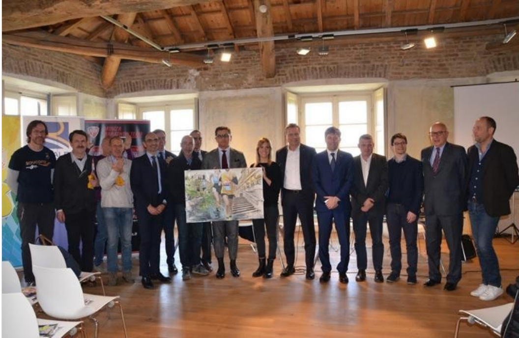
Foto di gruppo al termine della presentazione

Confermata anche la preziosa collaborazione con Sam - Società Alpinisti Monzesi, con Ari (Associazione Radioamatori) con Fisar Monza e Brianza, e con la partnership con il Valtellina Wine Trail, il prestigioso giro tra gli splendidi monti della Valtellina e i suoi vigneti patrimonio Unesco. Media partner dell'evento, tra gli altri, proprio il Cittadino. A ciò si aggiunge la nuova partnership con il circuito Follow Your Passion, organizzatori a Monza della 12 ore notturna di bicicletta presso l'Autodromo di Monza e della Mezza di Monza, manifestazione che vanta un'offerta di distanze dai 10 ai 30 chilometri.